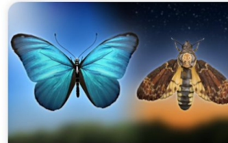
Butterflies & Moths